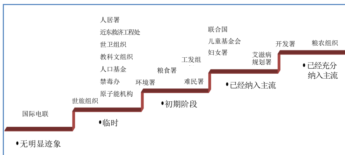
图 1 联合国系统各组织主流化程度的全面分析

71. 分析表明，联合国系统中接受本次审查的大多数组织(19 个组织中的 9 个，几乎占 50%)可归于就体面工作采取了“临时举措”一类。在原子能机构、人口基金、禁毒办、近东救济工程处和世卫组织等组织，体面工作问题构成了十分具体的工作领域。在原子能机构和世卫组织，上述领域涉及支柱 3(工作中的标准和权利)和社会保障。在禁毒办和近东救济工程处，检查专员观察到与体面工作相关的活动涉及支柱 1(创造就业和企业发展)。人口基金在支助 2(社会保障)方面开展了有效的工作。将世旅组织置于“无明显迹象”和“临时举措”之间的过渡区域，是因为尽管该组织明确开展了为消除贫困发展可持续旅游业的具体工作，但是它负有就体面工作议程所有四个支柱开展工作的任务，因此检查专员认为它应该更积极地将体面工作纳入其活动。